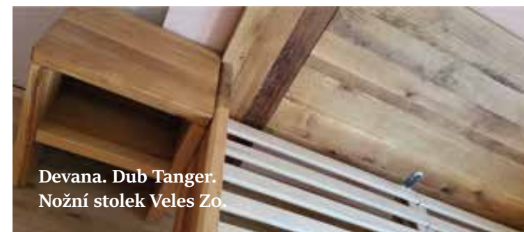
Devana. Dub Tanger. Nožní stolek Veles Zo.