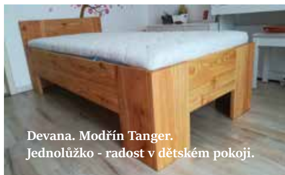
Devana. Modřín Tanger. Jednolůžko - radost v dětském pokoji.