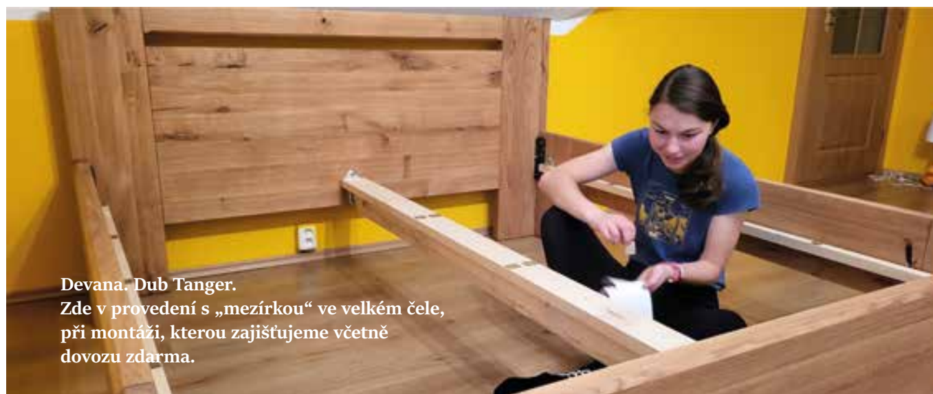
Devana. Dub Tanger. Zde v provedení s „mezírkou“ ve velkém čele, při montáži, kterou zajišťujeme včetně dovozu zdarma.