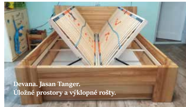
Devana. Jasan Tanger. Úložné prostory a výklopné rošty.