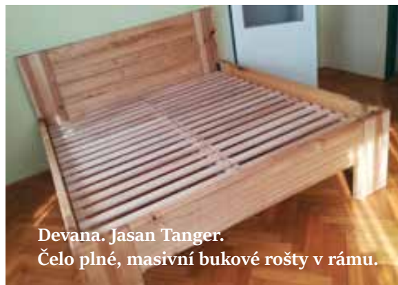
Devana. Jasan Tanger. Čelo plné, masivní bukové rošty v rámu.